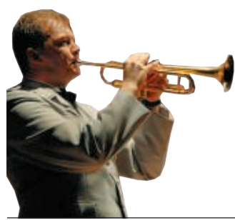
Delitzsch Fans feiern Militärmusiker Seite 20